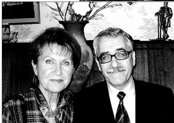
Cu fratele Ștefan