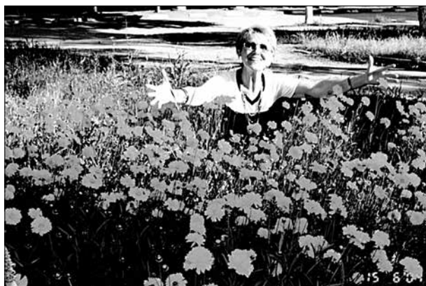
Frumusețea n-are margini...