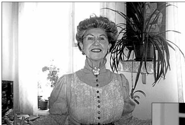
Spectacolul „Unchiul Vania”, de Anton Cehov, rolul Verei Petrovna

În Italia – un recital pentru conaționali noștri