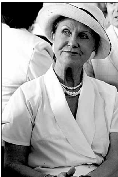
La o întâlnire cu spectatorii