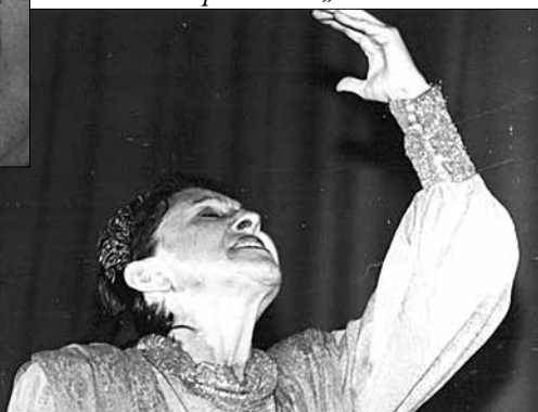
În spectacolul „Psalmii lui David”