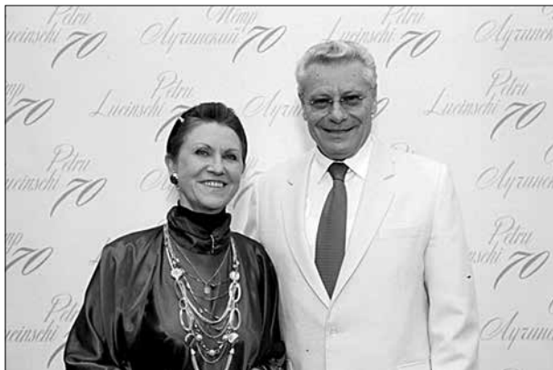
Cu președintele Republicii Moldova Petru Lucinschi