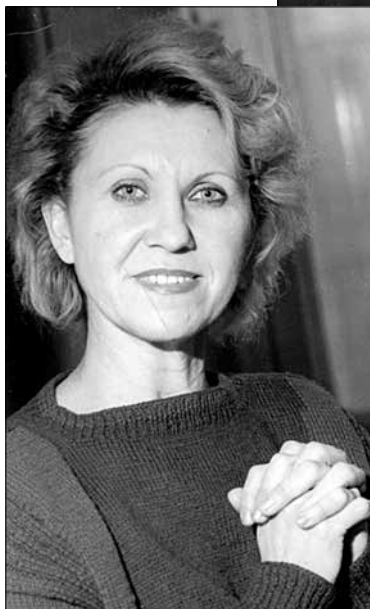
Sunt pentru prima oară la București. 1990