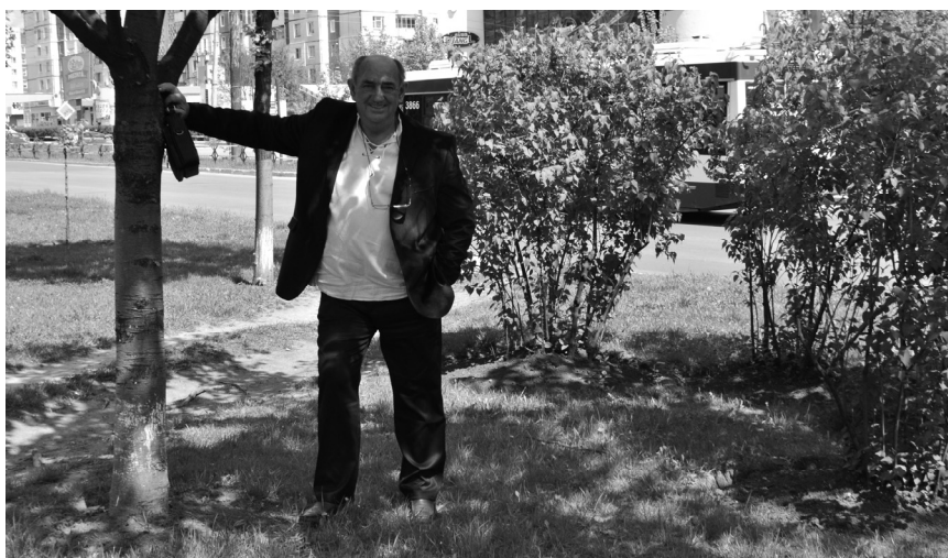
Liliacul, floarea preferată