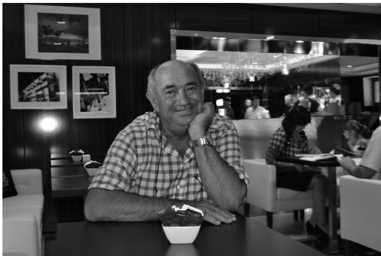
Încercarea de a fi modern... într-o cafenea