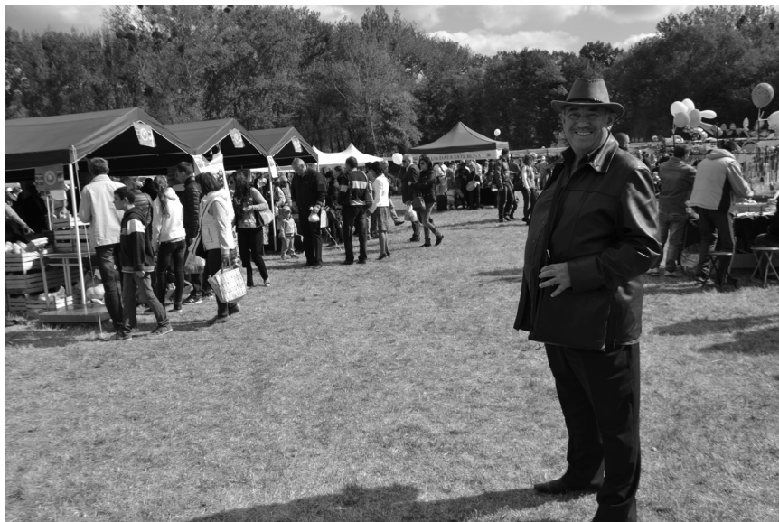
Bostaniada – 2014. Ultima ieșire