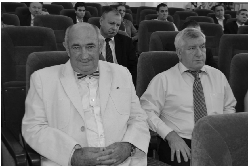
Solemn ca la o adevărată Academie