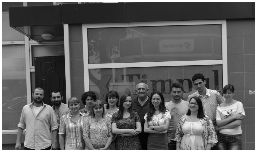
Mereu împreună cu Timpul