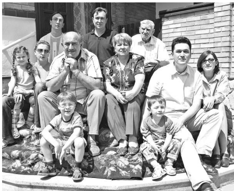
Pragul casei de la Trușeni i-a adunat ... dar a fost demult