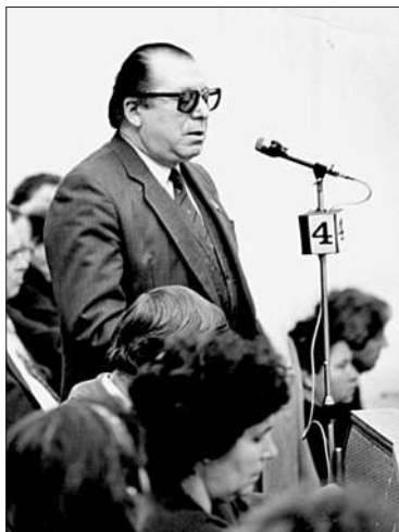
Deputat în Sovietul Suprem al RM