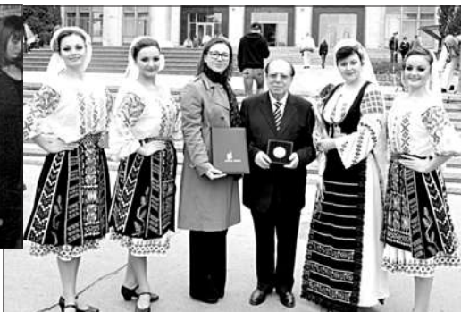
Premiat cu distincție a organizației mondiale de Proprietatea Intelectuală - Medalia de Aur pentru Creativitate 2013