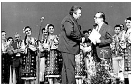
Mircea Snegur, Președintele Republicii Moldova, decernează maestrului Vladimir Curbet Ordinul Republicii Moldova, 1992