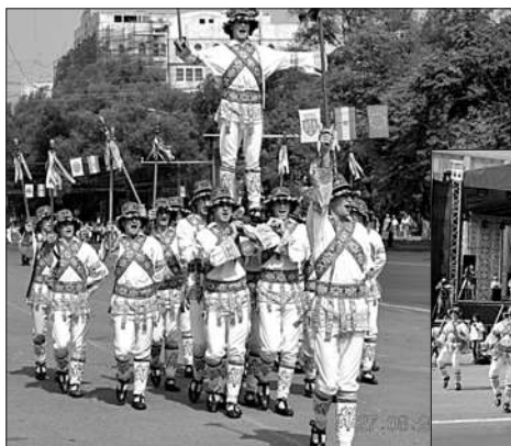
Schite din Dansul Călușarii în Piața Marii Adunări Naționale, 2015