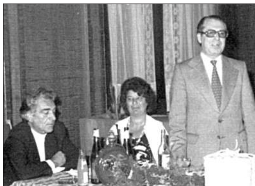
Vladimir Curbet la o conferință de presă în America Latină