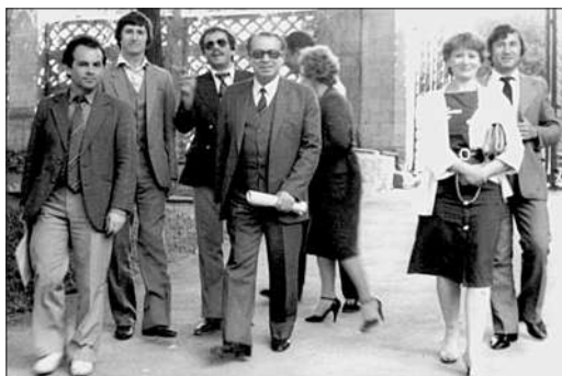
O plimbare prin oraș cu un grup de interpreți ai Ansamblului JOC, 1985

Indicații și sugestii înainte de concert