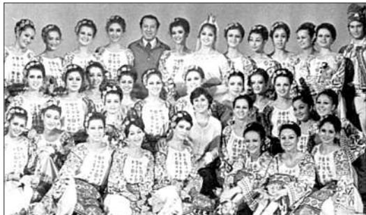
Colectivul ansamblului JOC, grupul feminin, 1978