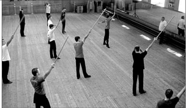
Repetiția Ansamblului JOC