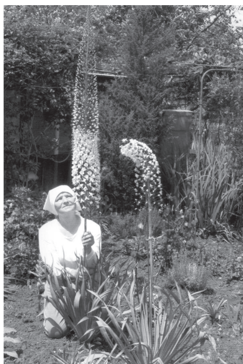
... și falnicul eremurus, 2007