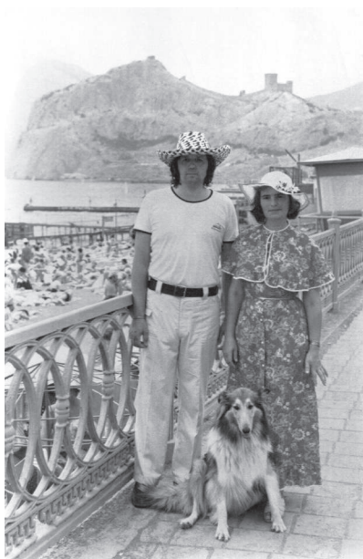
La odihnă în Crimeea, Sudac, 1988