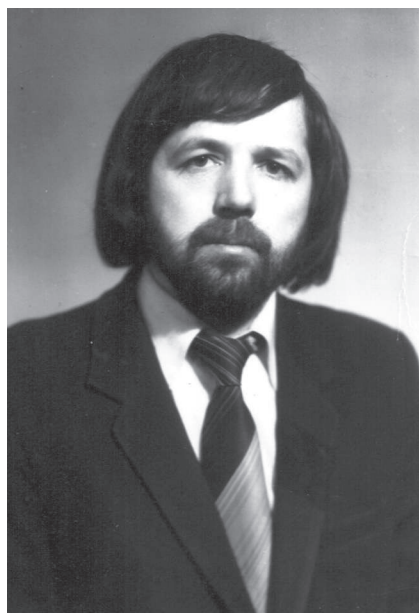
Îndurerat de decesul mamei, 1985