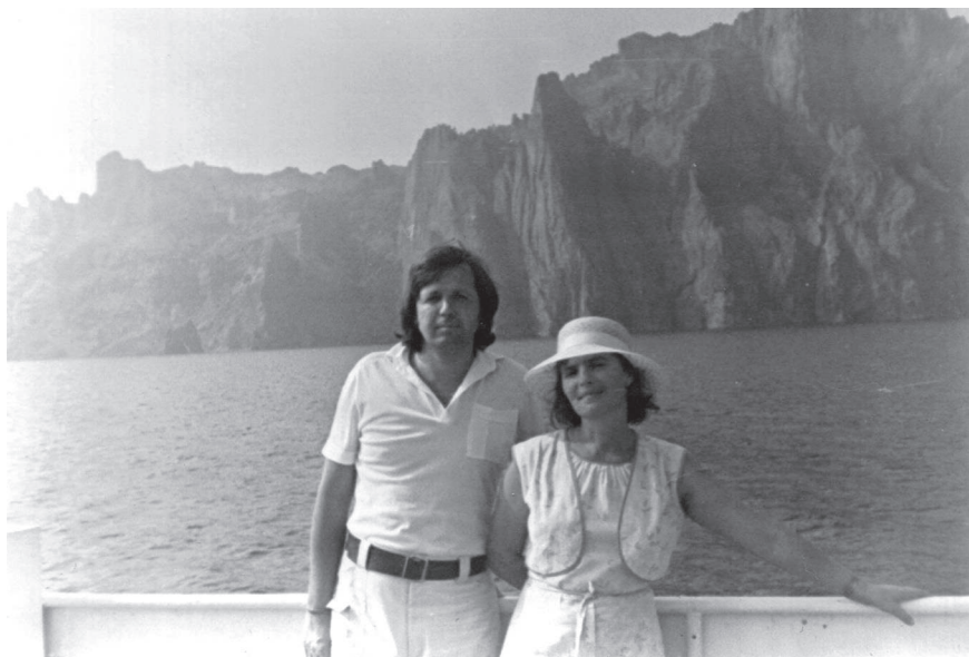
Crimeea. Pe mare spre Koktebel, 1984