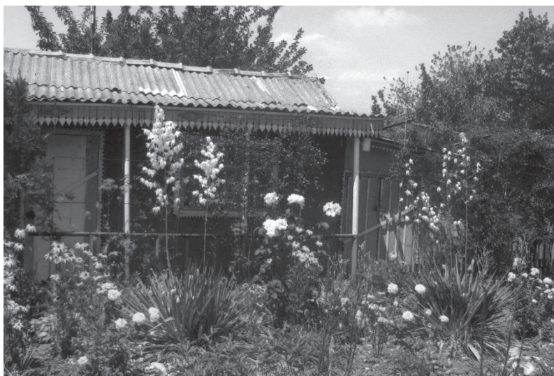
Vila „Eternul Verde” de la Râșca, Criuleni, străjuită vara de magnifica Yucca...