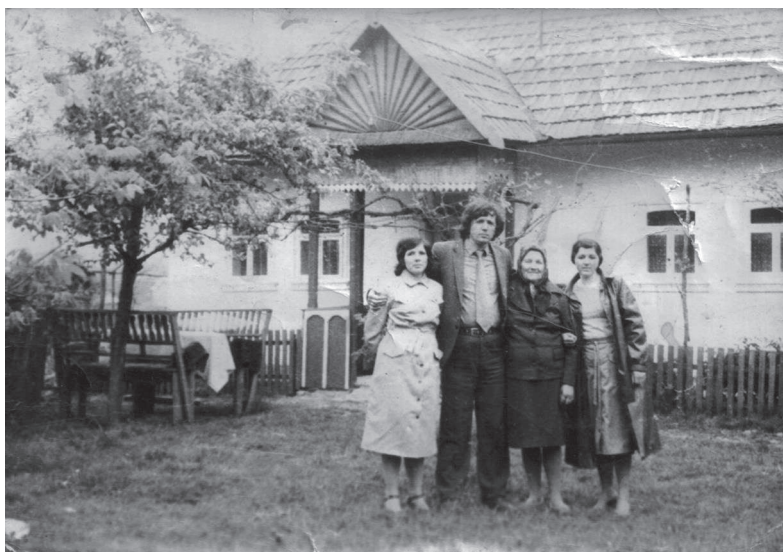
În curtea casei părintești, 1982