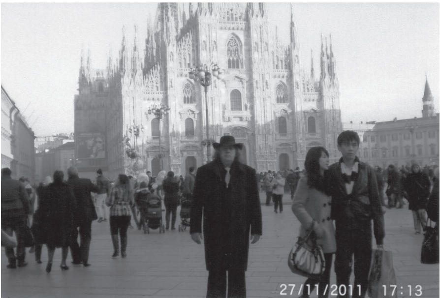
În fața „Duomo di Milano”, 2011