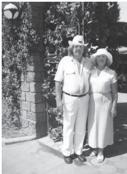
La odihnă, 2013