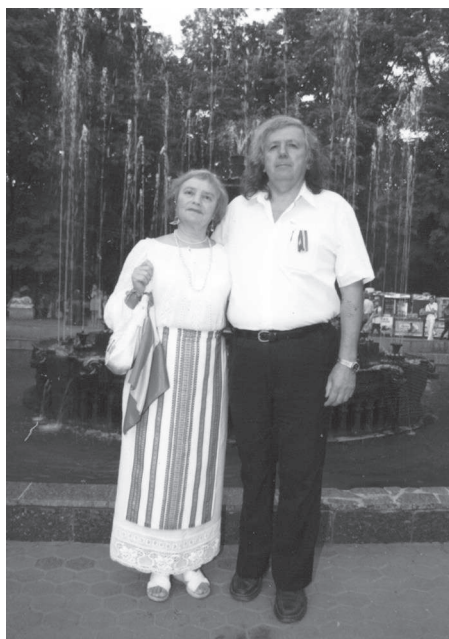
De Ziua Independenței, în Grădina Publică Ștefan cel Mare, 2011