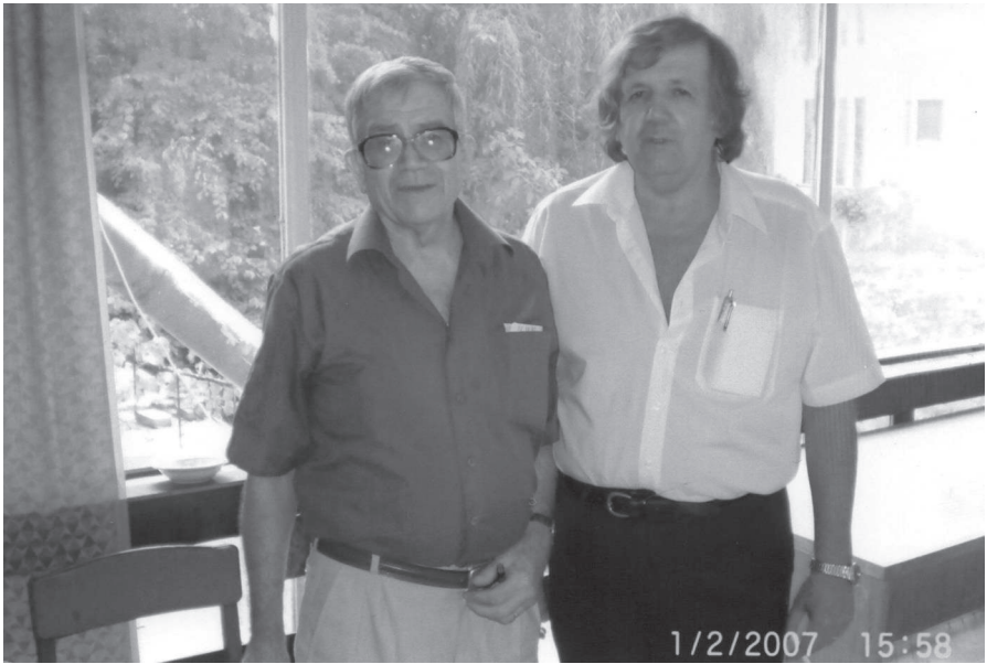
Cu regretatul Anatol Ciocanu, 2009