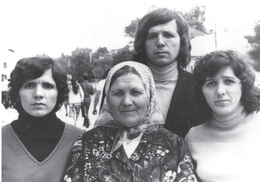
Cu mama și cu două surori în Chișinău, 1980