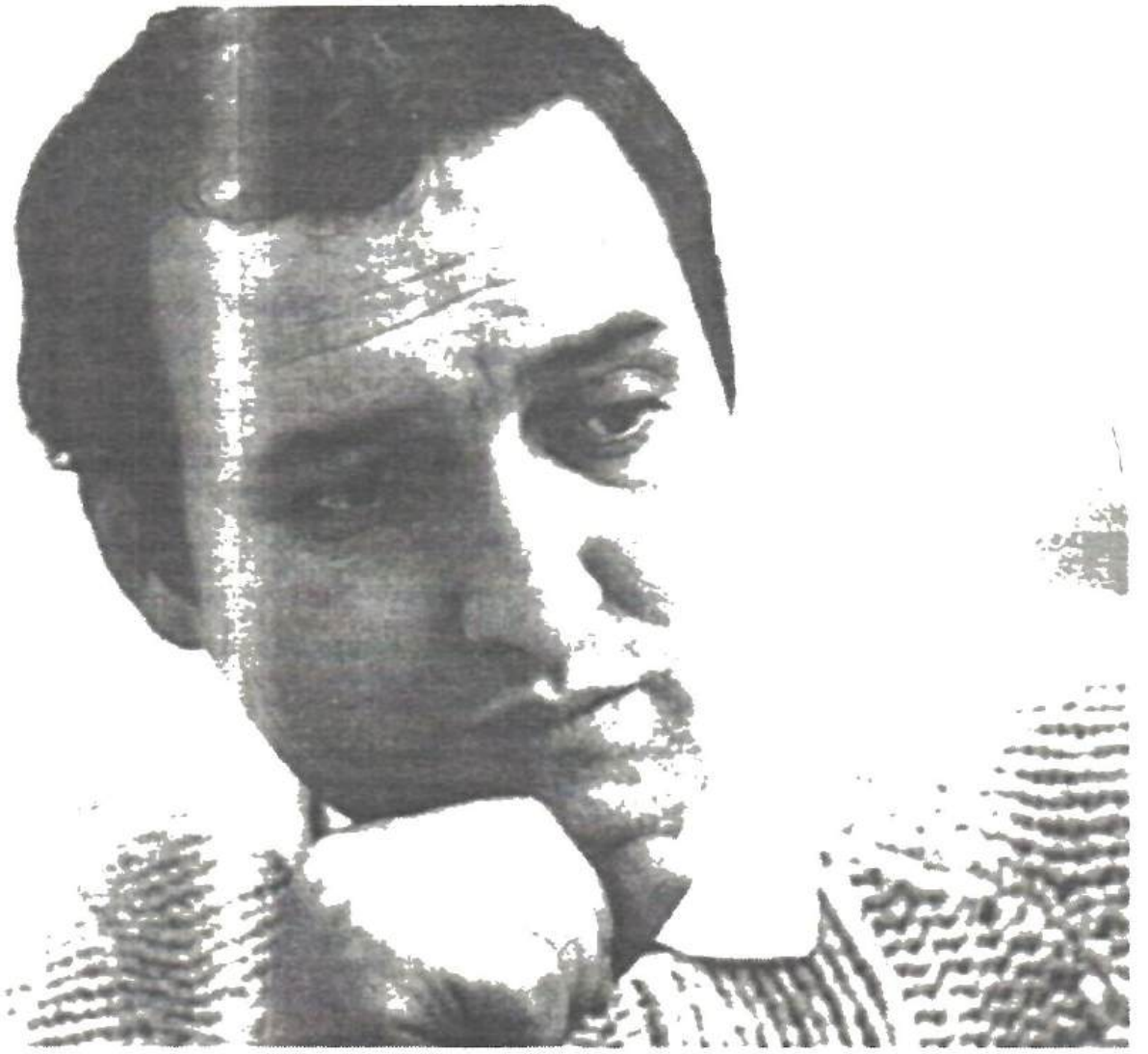
Sfârșitul anilor '60 - membru al Uniunii Scriitorilor