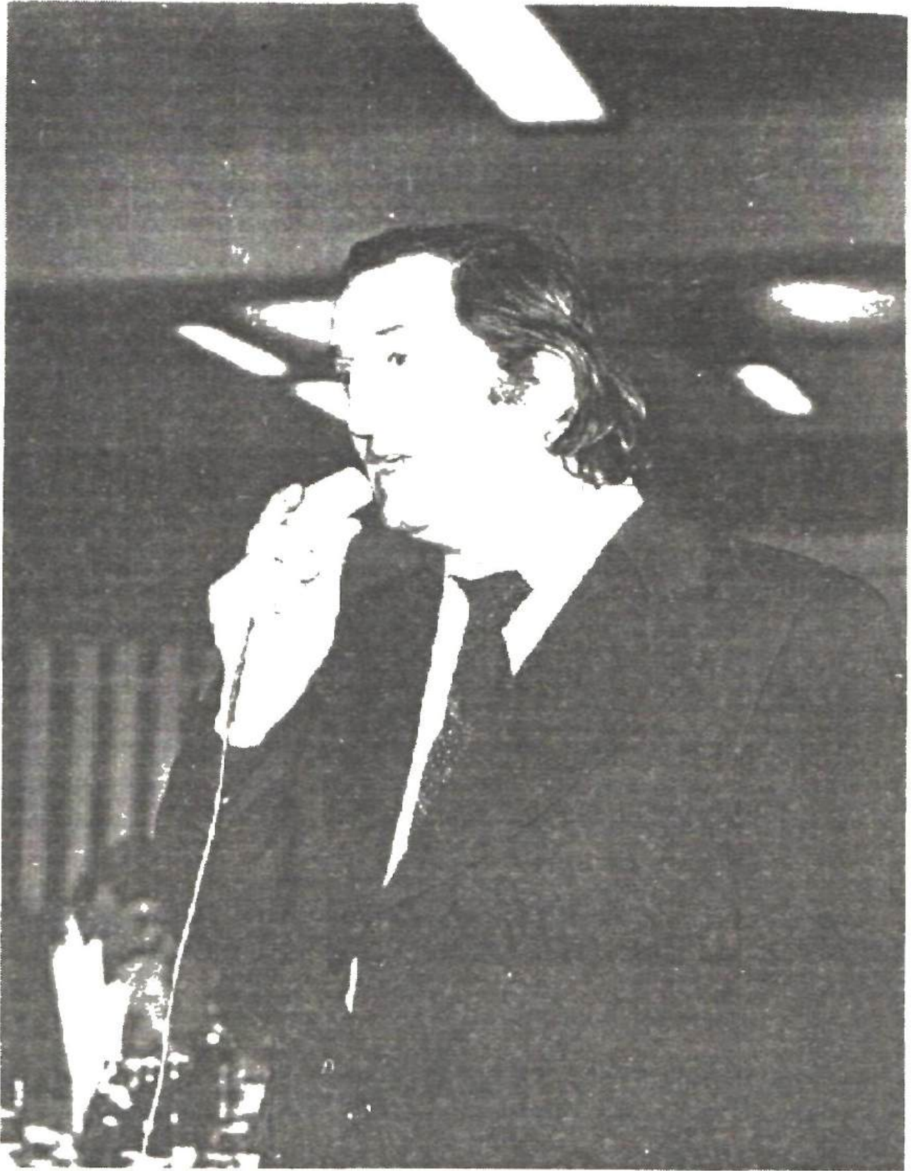
Sfârșitul anilor '80. La o seară literară