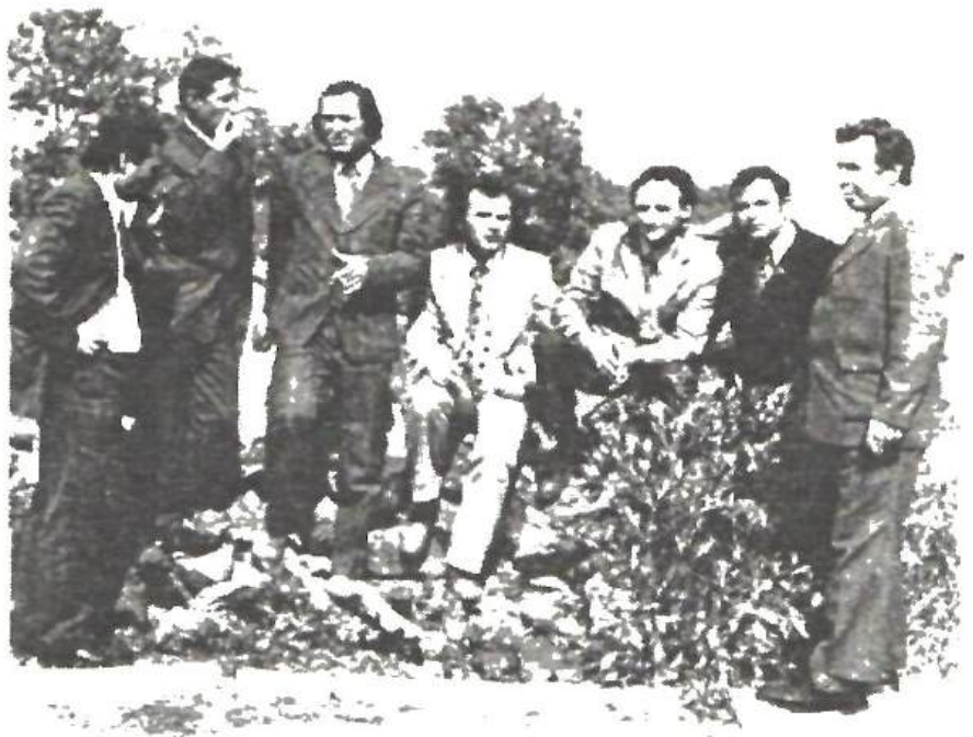
Participanți la "Zilele Eminescu"