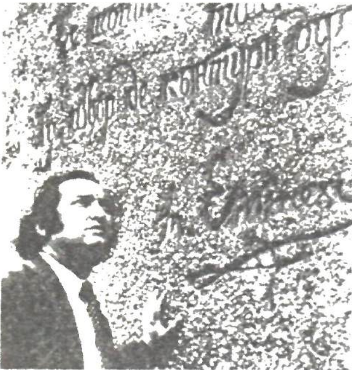
La izvorul din satul Recea, Rîșcani