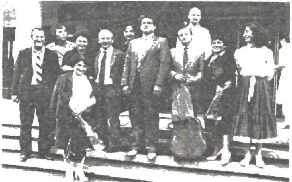
O întâlnire cu cititorii la nordul Moldovei