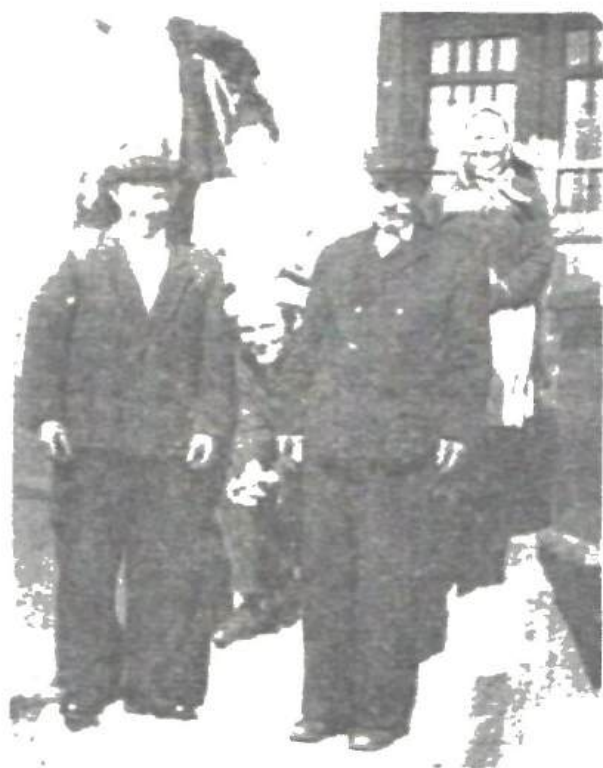
1962, cu rudele de la Negrești, Strășeni