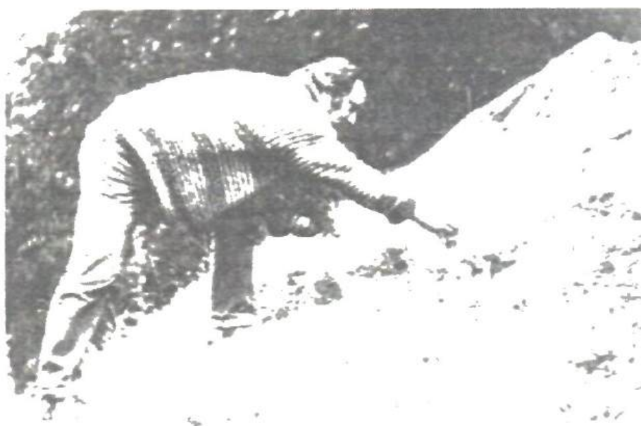
1984, în Carpații Bucovinei