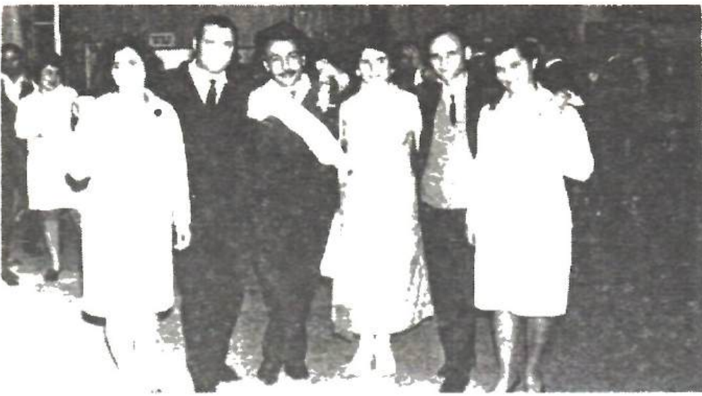
La o nuntă