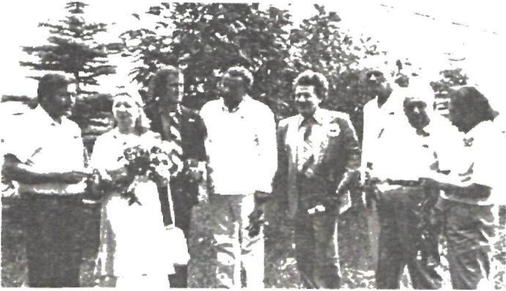
La un "Cireșar"