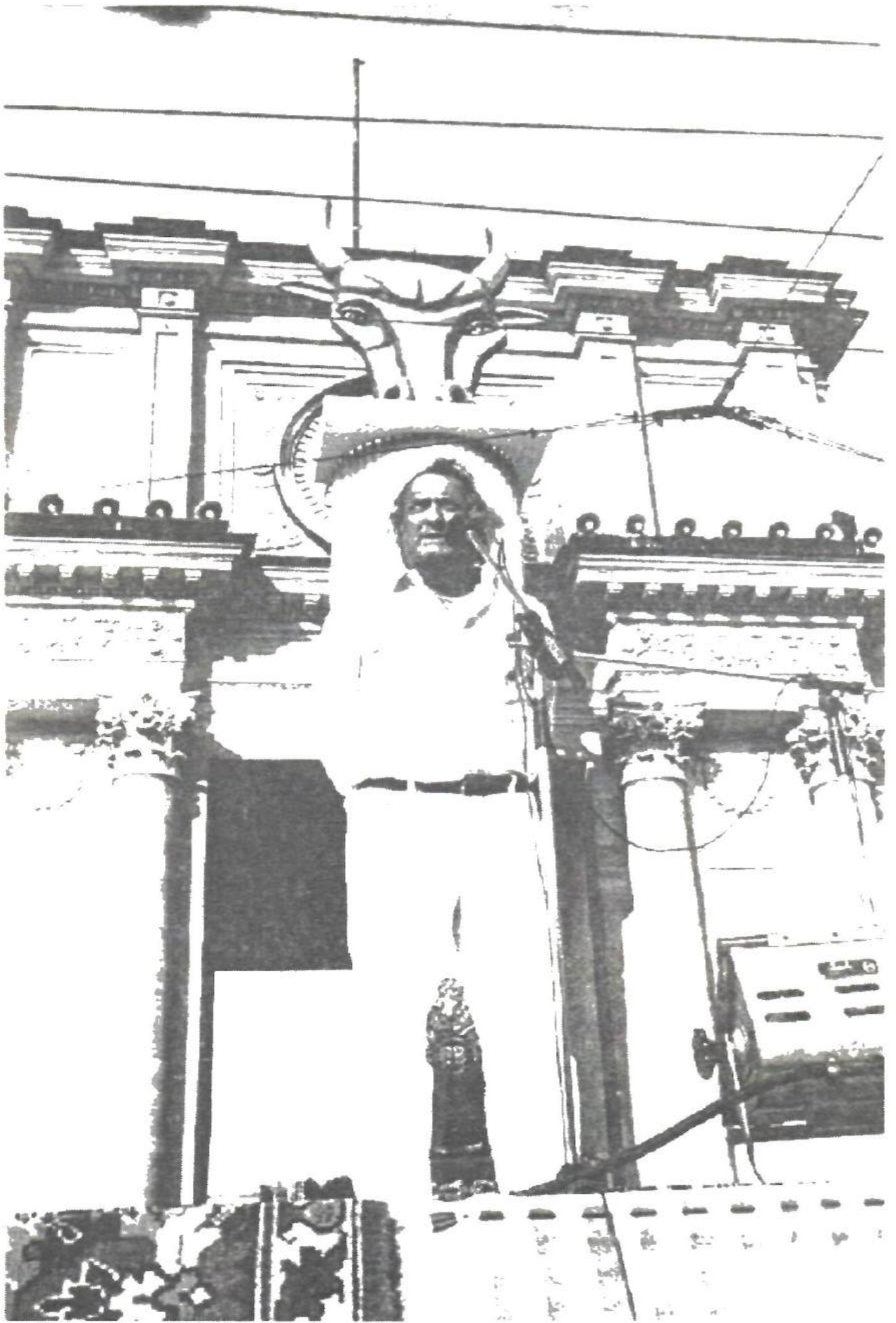
Anii '90 La sărbătoarea "Limba noastră"