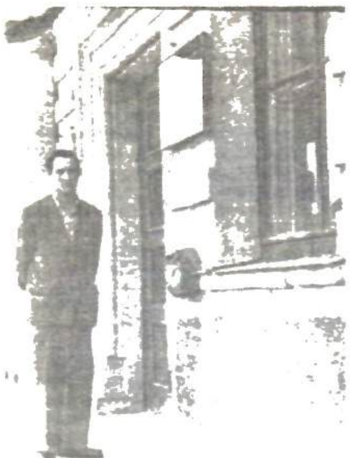
Student în fața blocului al U.S.M.