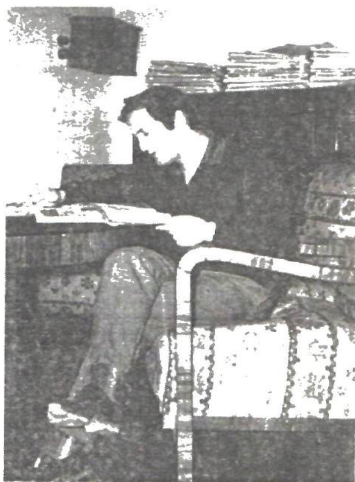
La Uniunea Scriitorilor, la un repaus