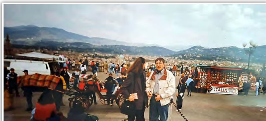
O explorare a Florenței, în timpul stagiului de cercetare din cadrul proiectului Tempus-Tacis, 1996