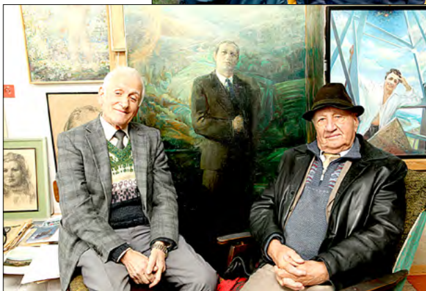
Pe fundalul „Portretului Ioan Paulencu”, pictat de Ion Daghi