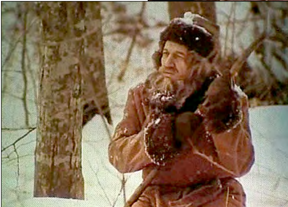
Ivan Susanin („Ivan Susanin”, Mihail Glinka)