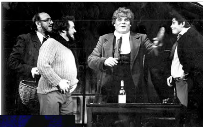
Filozoful Colline („Boema”, Giacomo Puccini)