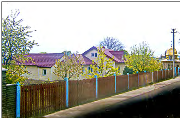
Ansamblul gospodăriei cu bisericuța din colțul grădinii