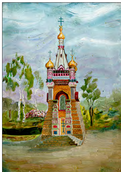
Bisericuță din or. Grodno. Ulei, carton. 1977