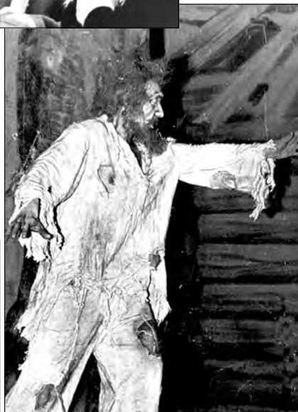
Morarul („Rusalka”, Alexandr Dargomijski), anii de studenție, 1972