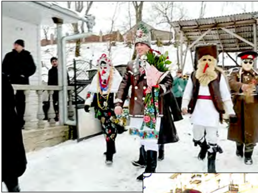
Alaiul „Mălăncii”, s. Voloca