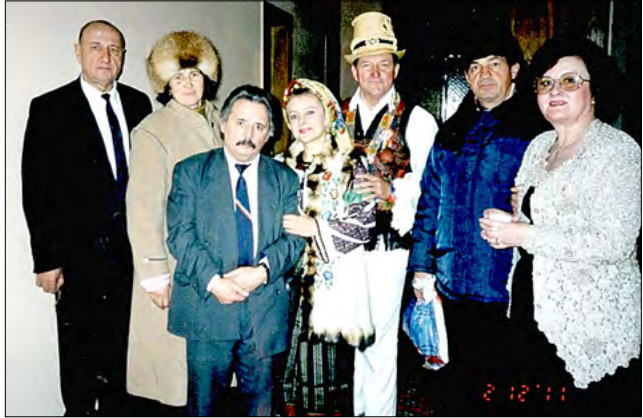
Concurs de muzică populară, Cernăuți