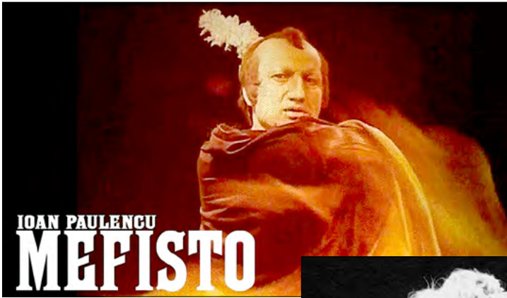
Mefisto (secvență din filmul televizat „Eu mi-am ales cântecul”)