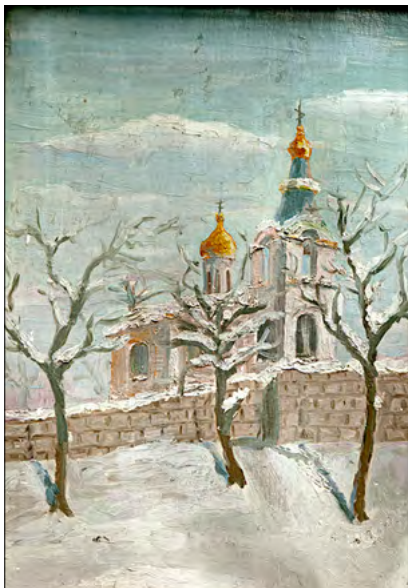
Biserica Sfintei Treimi, Chişinău. Ulei, carton, 1976