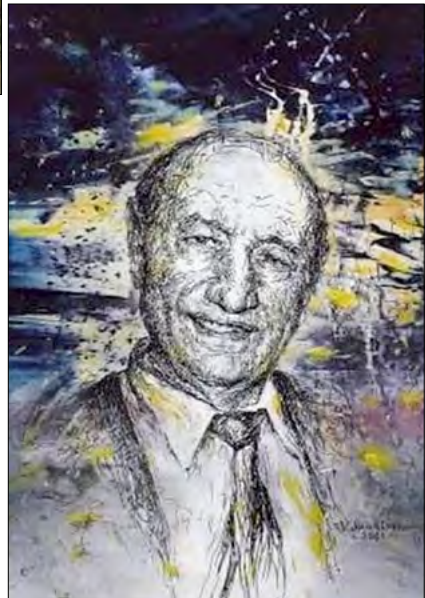
„Ioan Paulencu. Portret”. Tehnică mixtă, pânză, autor Victor Marinescu, 2021