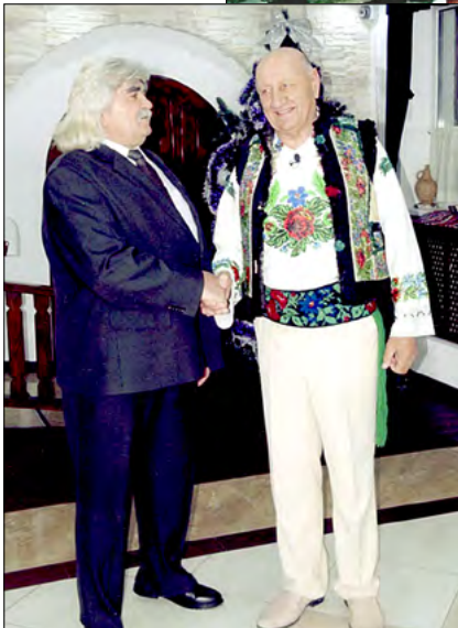
Cu prietenul de suflet – jurnalistul, poetul și scriitorul Ionel Căpiță