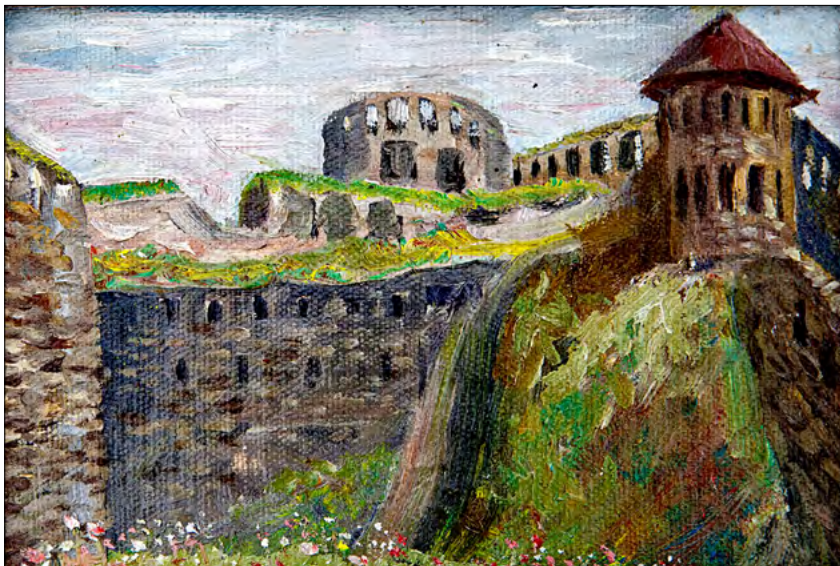
Cetatea Albă. Ulei, pânză, carton, 1976