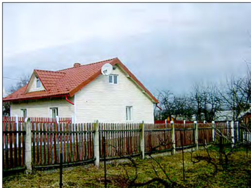
Casa maestrului Paulencu și fântâna din curtea casei