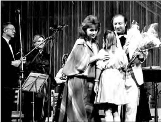
Secvență de la o serată de creație, 1975