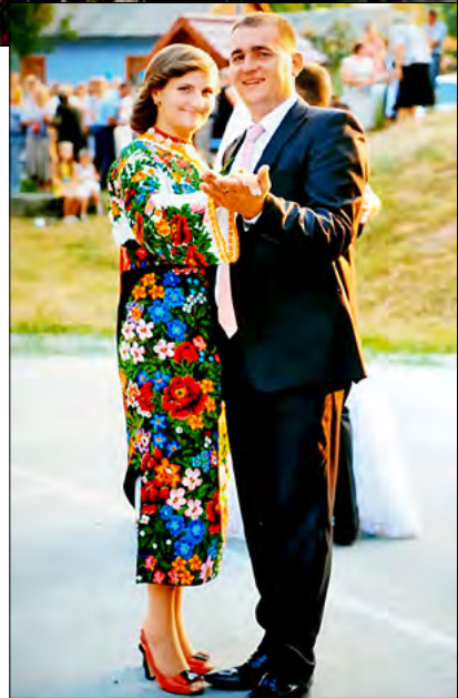
La o nuntă bucovineană