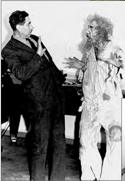
Scenă din opera „Faust”, Charles Gounod (anii de studenție, 1971)