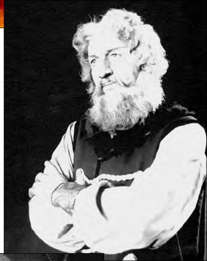
Sobakin („Mireasa țarului”, N. Rimski-Korsakov)