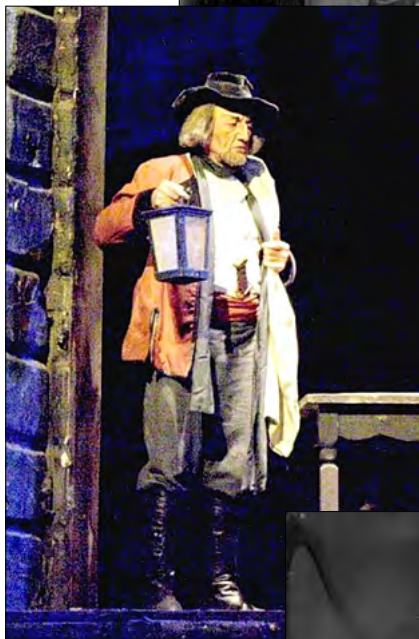
Temnicerul („Toska”, Giacomo Puccini)