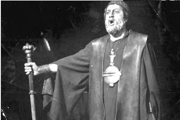
Oroveso („Norma”, Vincenzo Bellini)