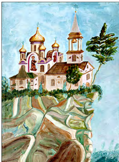
Biserica din Jitomir. Ulei, carton, 1976