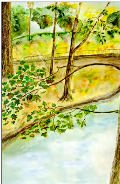
Peisaj cu lac. Grodno. Ulei, carton, 1977