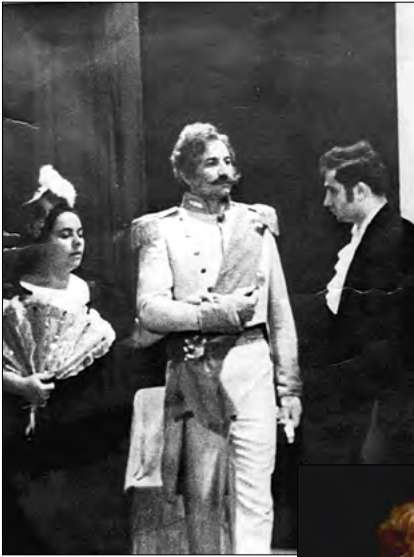
Cneazul Gremin („Evgheni Oneghin”, P.I. Ceaikovski), anii de studenție, 1971