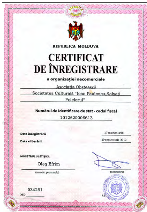
Certificat de înregistrare a Societății Culturale „Ioan Paulencu – Salvați Folclorul”