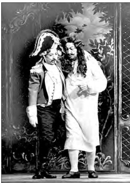
Farmacistul Hanibal („Clopoțelul”, Gaetano Donizetti)