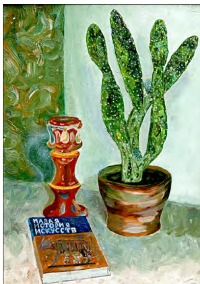
Natură statică cu cactuși. Ulei, carton, 1976