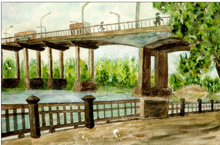
Pod peste râul Don. Acuarelă, hârtie, 1975