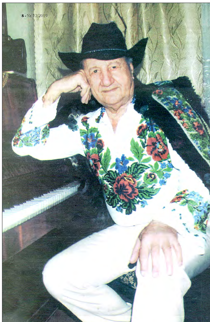
Cu dor și drag de Bucovina. Foto: Vasile Șoimaru, 2015