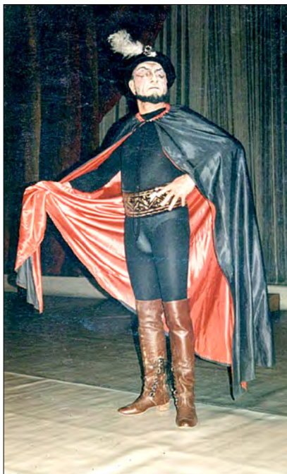
Mefisto („Faust”, Charles Gounod)