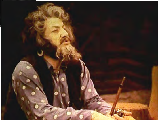
Bătrânul țigan („Aleko”, Serghei Rahmaninov)