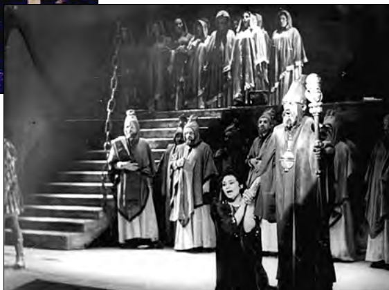
Oroveso – Ioan Paulencu, Norma – Maria Bieșu („Norma”, Vincenzo Bellini)