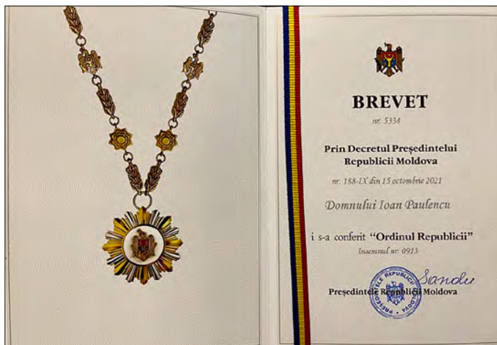
„Ordinul Republicii”, brevet