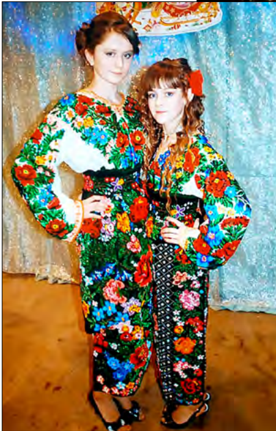
Port popular bucovinean