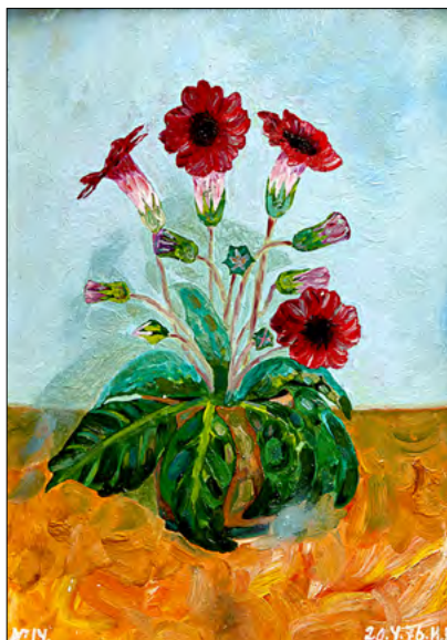
Vază cu flori. Ulei, carton, 1976