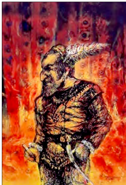
„Mefisto”. Tehnică mixtă, pânză, autor Victor Marinescu, 2021