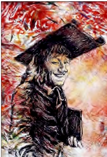
„Don Basilio”. Tehnică mixtă, pânză, autor Victor Marinescu, 2021