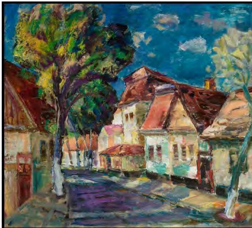
Orașul în soare (str. Gr. Ureche), Sergiu Galben