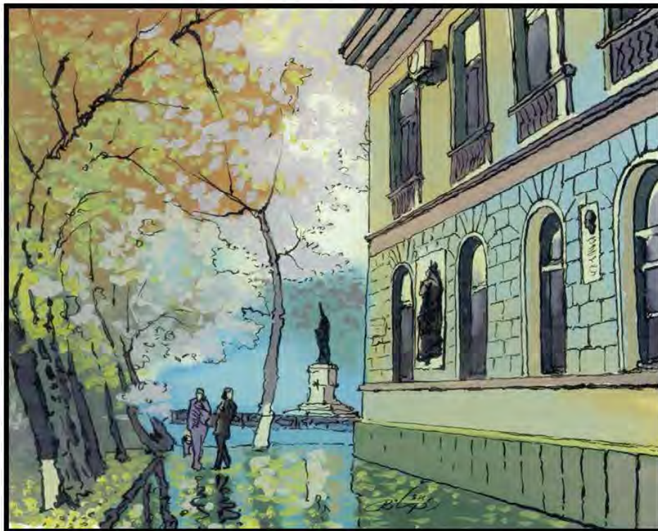
Strada Mitropolit Gavriil Bănulescu-Bodoni, Petru Rilschi