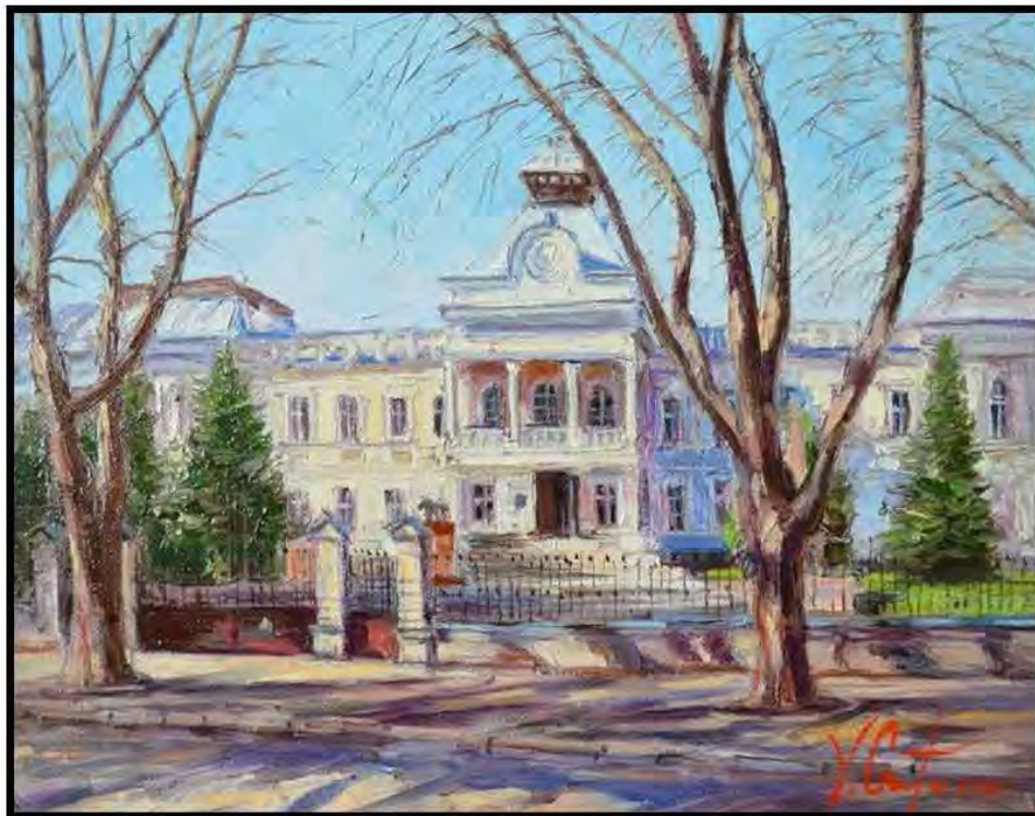
Muzeul Național de Istorie a Moldovei, Victor Crețu