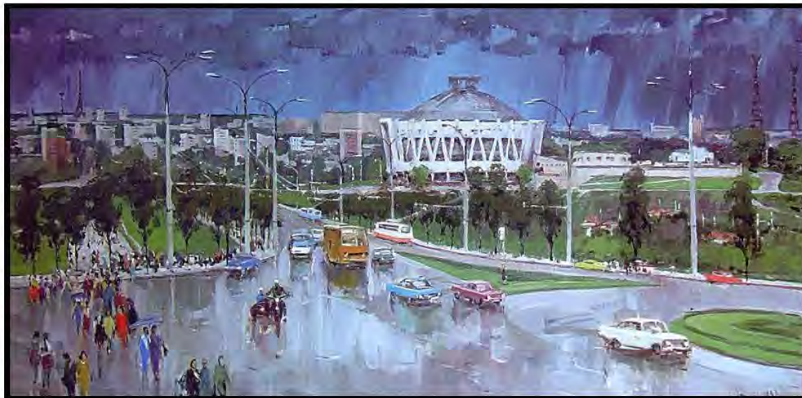
După ploaie în sectorul Râșcani, Iurie Șibaev