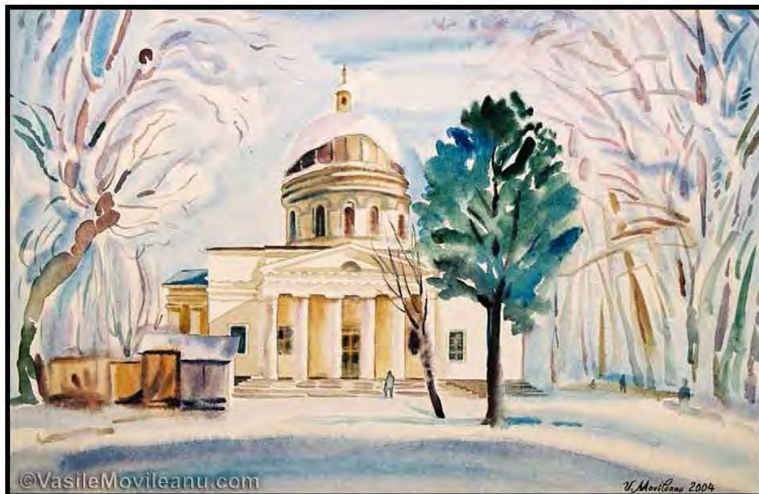
Catedrala Nașterea Domnului, Vasile Movileanu