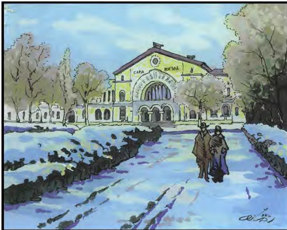
Gara feroviară, Petru Rilschi