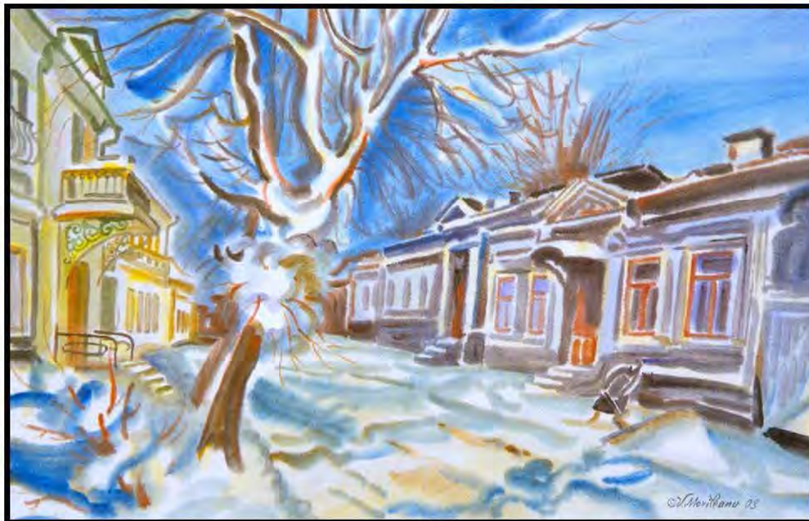
Strada Vasile Alecsandri, Vasile Movileanu