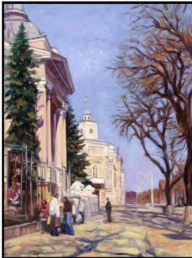
Sala cu Orgă, Victor Crețu