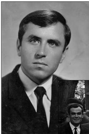
Student la Litere, anul I