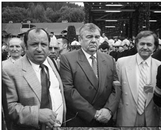
La Putna cu prilejul aniversării a 500 de ani de la trecerea în neființă a voievodului Ștefan cel Mare, 2004